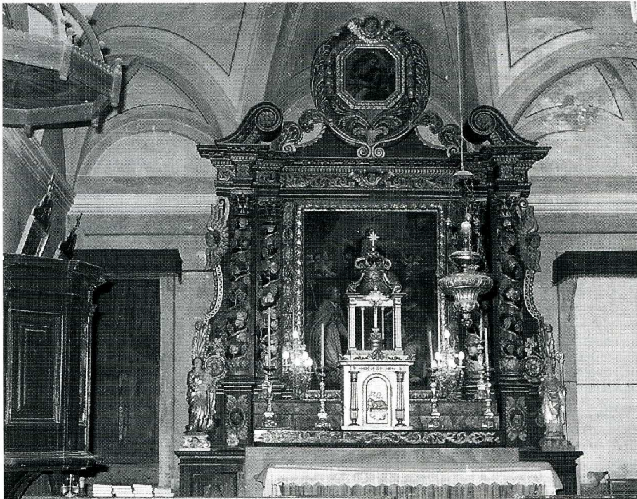
Albiez-Montrond (Savoie), église Saint-Nicolas. 1. Chœur avec le retable de Symond (1693) et le tableau de G. Dufour (1690). 2. Plan, éch. 0,005, n.s.n.d.