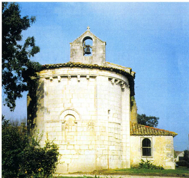
Allas-Bocage (Charente-Maritime) Église Saint-Martin 1. Façade occidentale et façade sud 2. Façade est 3. Plan