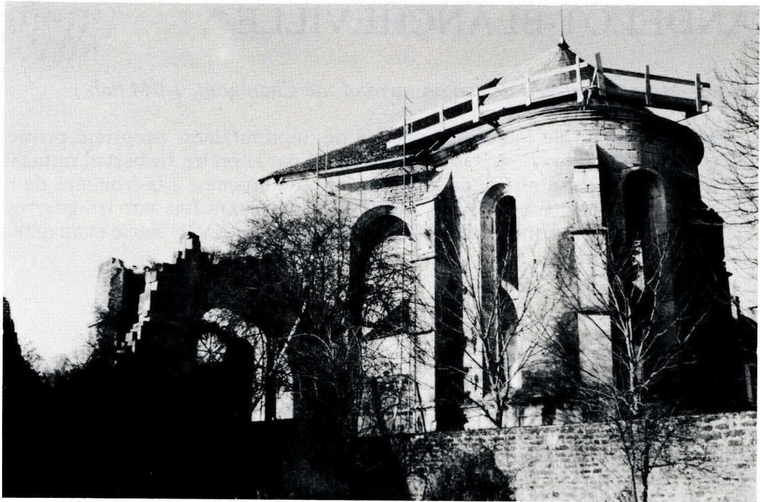
Andelot-Blancheville (Haute-Marne). Chapelle de l'ancienne abbaye de Septfontaines.