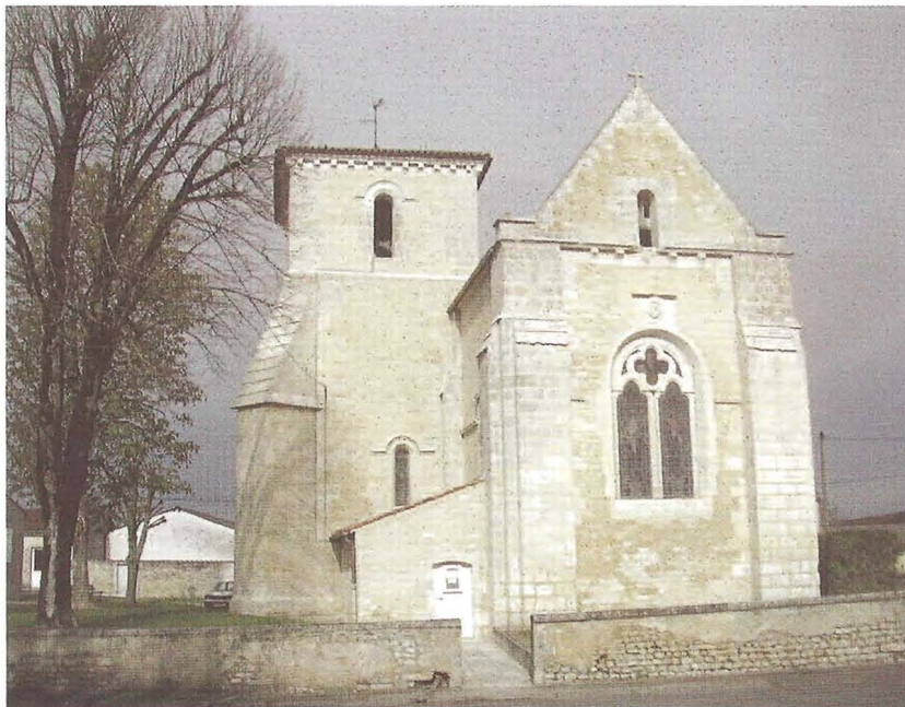
Angeac-Champagne (Charente) Église Saint-Vivien