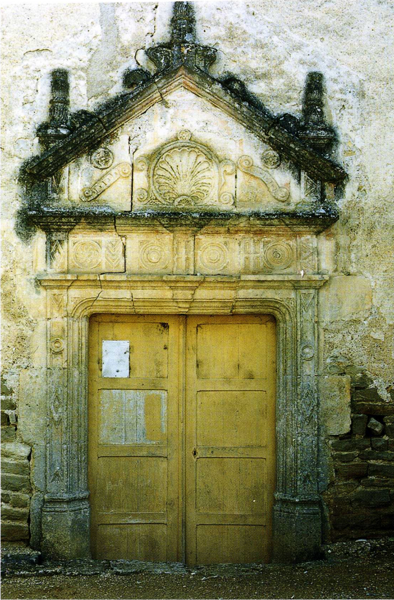
Arcy-sur-Cure (Yonne) Chapelle Saint-Roch Porte de la façade occidentale

l'extérieur, les murs sont en petit appareil de pierre du pays et couronnés d'une corniche de pierre moulurée d'un cavet. On pénètre dans la chapelle soit par le portail de la façade occidentale, soit par une porte à linteau droit au côté nord. À l'intérieur, les trois travées d'esprit flamboyant sont couvertes de voûtes sur croisées d'ogives, au profil prismatique, pénétrant dans les colonnes engagées sans l'intermédiaire de chapiteaux. La première travée est aveugle, les autres sont éclairées par des fenêtres en arc brisé. Mais le plus bel élément reste le portail occidental, témoin intéressant de la première Renaissance française. Il est encadré de pilastres, surmonté d'un entablement décoré de rosaces, au-dessus duquel s'épanouit une belle coquille entre des candélabres.