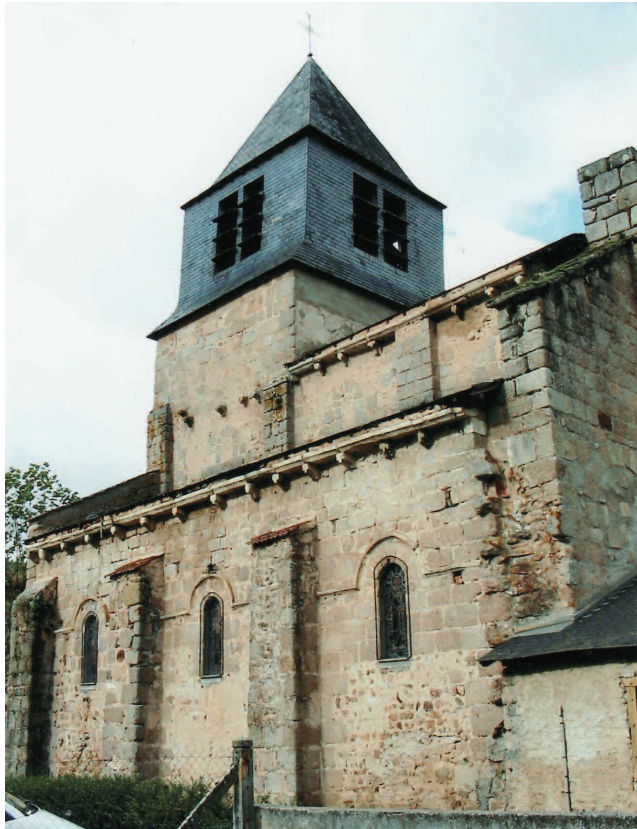
3. Façade sud

de long, flanquée de bas-côtés et terminée à l'est par une abside en hémicycle précédée d'une courte travée droite, disposition courante dans les édifices clunisiens. La nef centrale est voûtée en berceau brisé, autre trait rattachant le monument à la Bourgogne, alors que les bas-côtés, comme c'est souvent le cas en Auvergne, ont reçu des demi-berceaux. Le clocher, de plan quadrangulaire, à la flèche couverte d'ardoises assez massives, s'élève au-dessus de la première travée ouest de la nef. Au-dessous, l'encadrement de la porte d'entrée de l'édifice, appareillé en calcaire assez clair, se distingue du reste du monument, construit en granit de la Montagne Bourbonnaise.