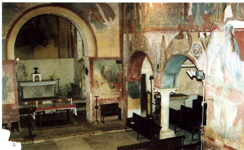
E. Hubert, Le Bas-Berry, histoire et archéologie du département de l'Indre , t. I-[1], Canton d'Ardenes , Paris, 1902, p. 41-60 : "Arthon" (p. 41-43 : sur l'église).