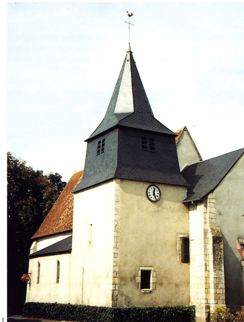
Arthon (Indre) Église Saint-Martin 1. Ensemble vu du sud-est