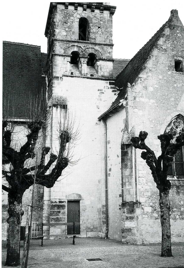
Athée-sur-Cher (Indre-et-Loire), église Saint-Romain, façade sud après restauration du clocher (mars 1995).

P lacée sous le vocable de saint Romain, l'église paroissiale d'Athée-sur-Cher était à la présentation alternative de l'archevêché de Tours et de l'abbaye Saint-Julien-de-Tours. La cure constituait un fief relevant de la seigneurie de Chenaie-Athée. L'église actuelle, vraisemblablement édifée sur une structure antérieure, remonte pour ses parties les plus anciennes au XIII e s. De cette époque datent la façade, le mur gouttereau méridional et le clocher construit sur le flanc sud de l'édifice, à la jonction de la nef et de l'avant-chœur. Au XVI e s., plusieurs campagnes successives de travaux modifièrent profondément le plan initial : le chœur, totalement remanié, fut reconstruit dans le style gothique flamboyant ; ses deux travées droites et son abside à trois pans ainsi que la chapelle sud furent toutes couvertes de voûtes sur croisées d'ogives