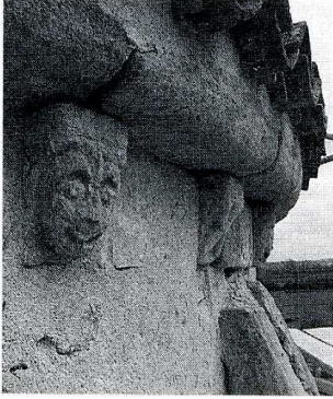
Avril-sur-Loire (Nièvre). Église Saint-Pierre, modillons sous la corniche de l'abside.