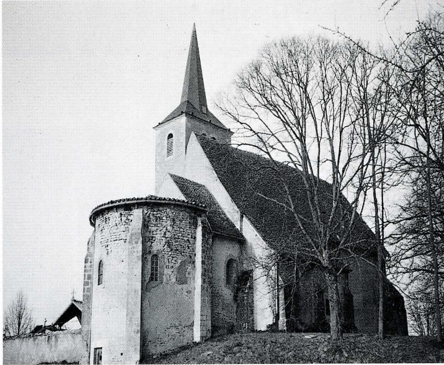
Avril-sur-Loire (Nièvre). Église Saint-Pierre, vue du nord-est.