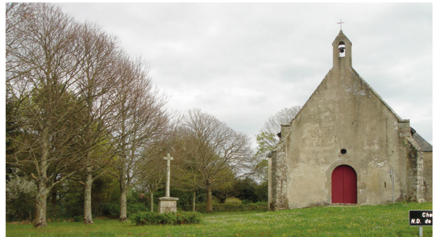
1. Façade occidentale

Canton Vannes-2, arrondissement Vannes, 4 505 habitants