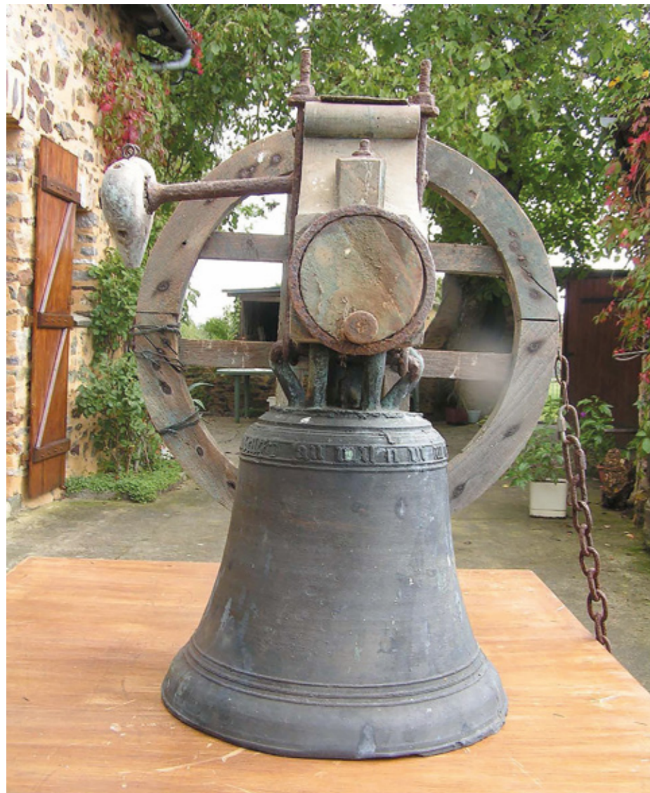
8. Cloche portant la date de 1506

Arch. dép. Mayenne, B 3643 et B 3821 ; 186 J 174 et 479 J 11 ; 5 Fi 26/8, 14 et 17-18 ; MS 80 28/11.