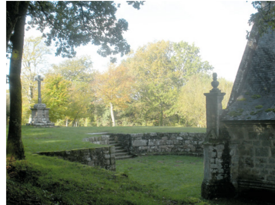
2. Vue du site

Les travaux réalisés ont permis de mettre au jour des peintures murales sur le mur du chevet, dont une scène d'Annonciation, qui serait contemporaine de la construction, tout comme la grande baie. Celle-ci a conservé son réseau supérieur, avec des remplages en quadrilobes et trilobes, caractéristiques des années 1430-1480 ; le vitrail a été remplacé au XX e siècle. La chapelle nord décorée d'un blason était primitivement celle des seigneurs