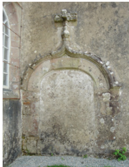
3. Ancienne porte d'entrée en façade sud

(Keralbaud, seigneurs de Kerdelan qui succèdent aux Rolland). C'est aussi à cette époque qu'est remonté le mur occidental, avec son porche surmonté d'un oculus.