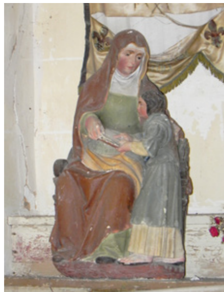
7. L'Éducation de la Vierge

dizaines de bouquets nuptiaux confiés notamment par les mariées de la région, dont les époux étaient rentrés vivants en 1918.