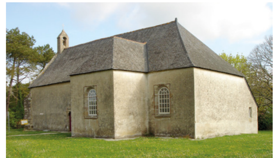
2. Vue nord-est

L'édifice présente plusieurs périodes de construction, du XVI e siècle au premier quart du XIX e siècle. À l'origine, son plan était celui d'un rectangle. Ainsi que l'a établi une étude de la charpente réalisée