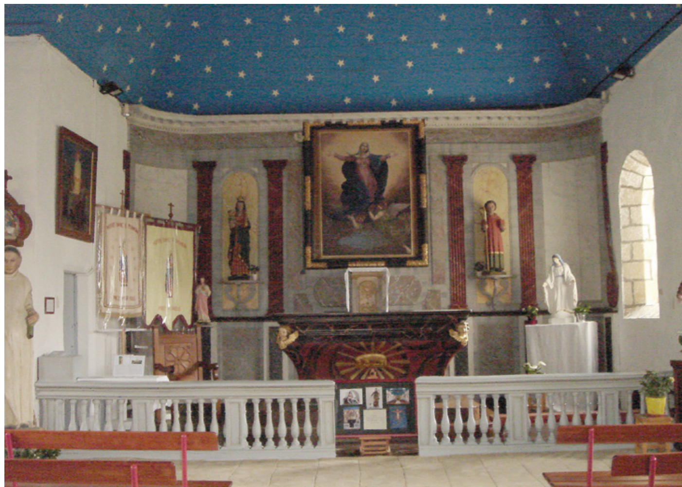
4. Vue intérieure vers le chœur