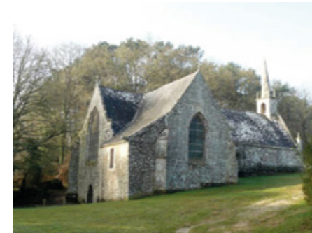
1. Vue nord-ouest

Canton Vannes-2, arrondissement Vannes, 2 180 habitants ISMH 1925