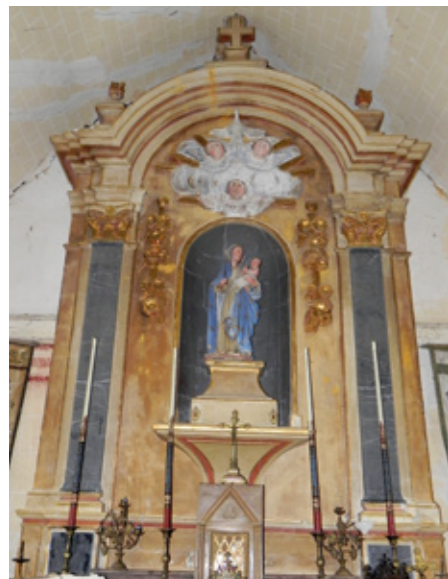
6. Retable avec statue de la Vierge à l'Enfant, XVIII e siècle