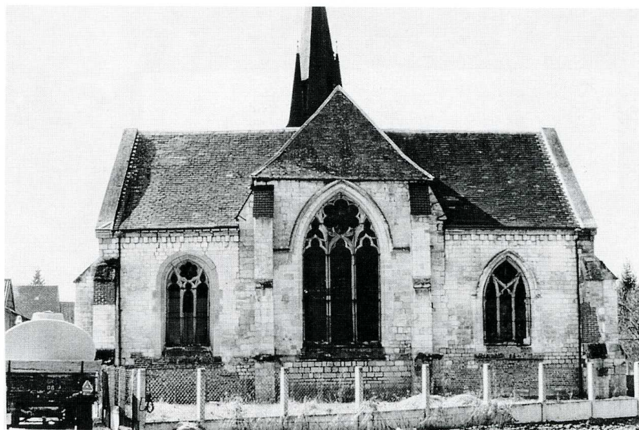
Balham (Ardennes), église Saint-Jean-Baptiste. 1. Chevet. 2. Bras sud du transept, après travaux (1995).

Ardennes, canton d'Asfeld, arrond. de Rethel, 103 hab.