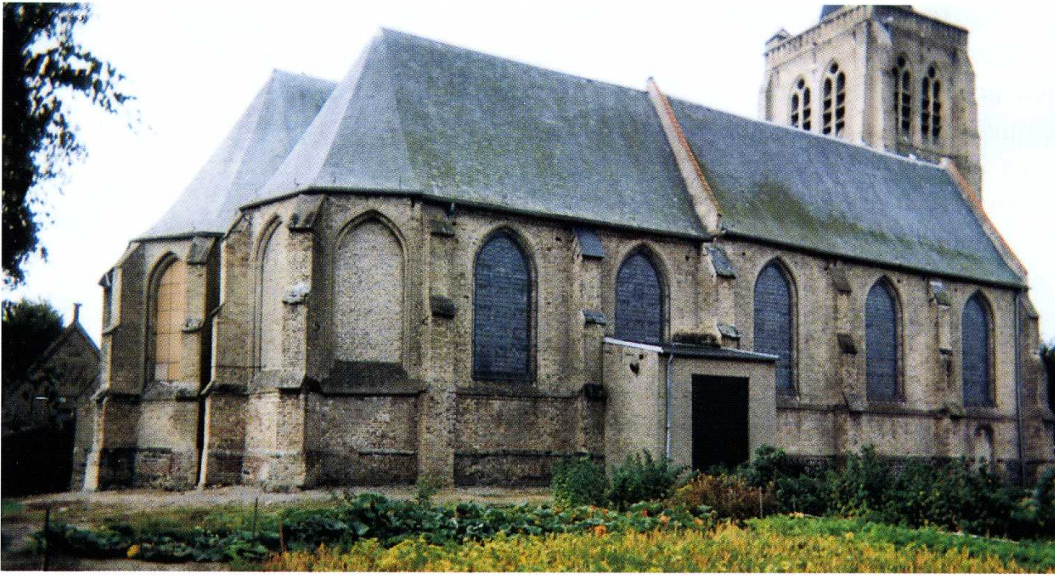
Bambecque (Nord) Église Saint-Omer 1. Façade nord