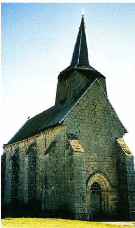
Banize (Creuse) Église Saint-Sulpice 1. Façade occidentale et façade nord 2. Plan