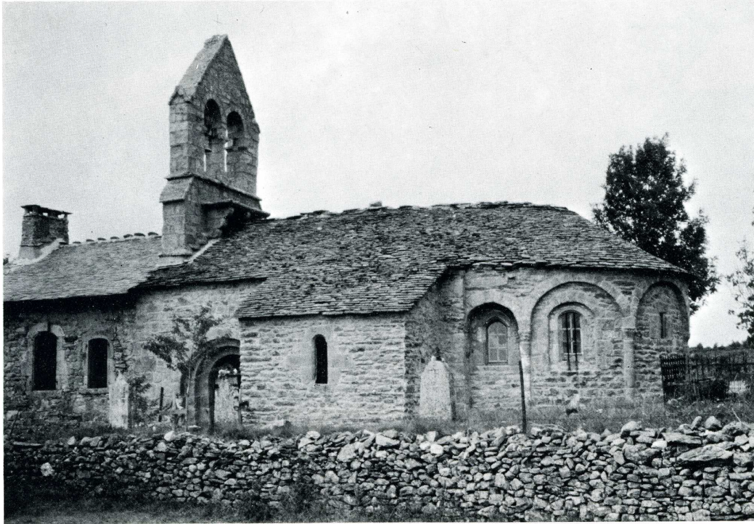
La Bastide-Puy-Laurent (Lozère).