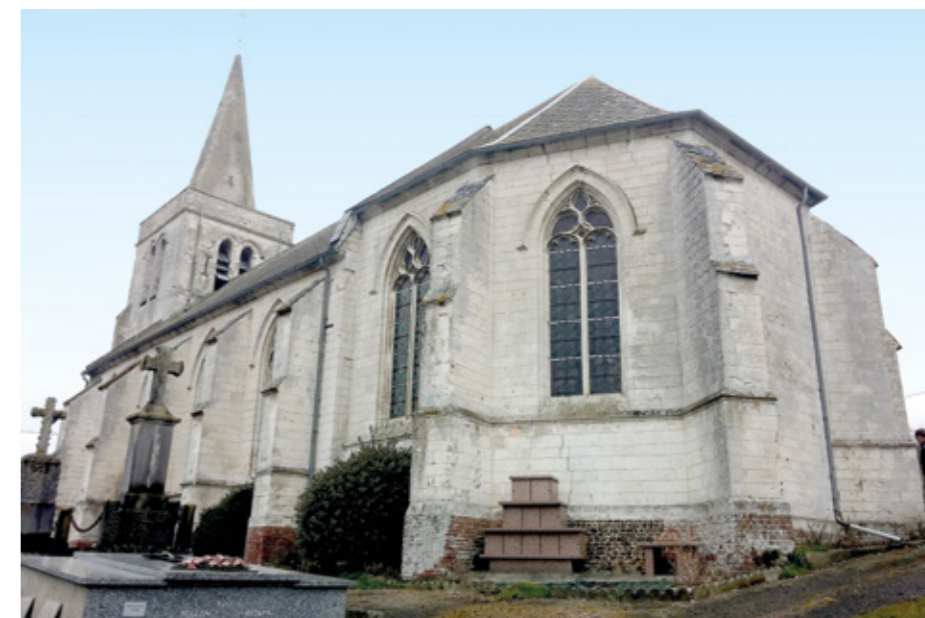
1. Façade sud-est