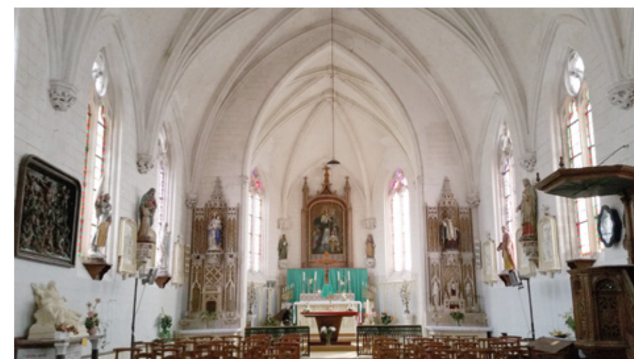
2. Vue du chœur