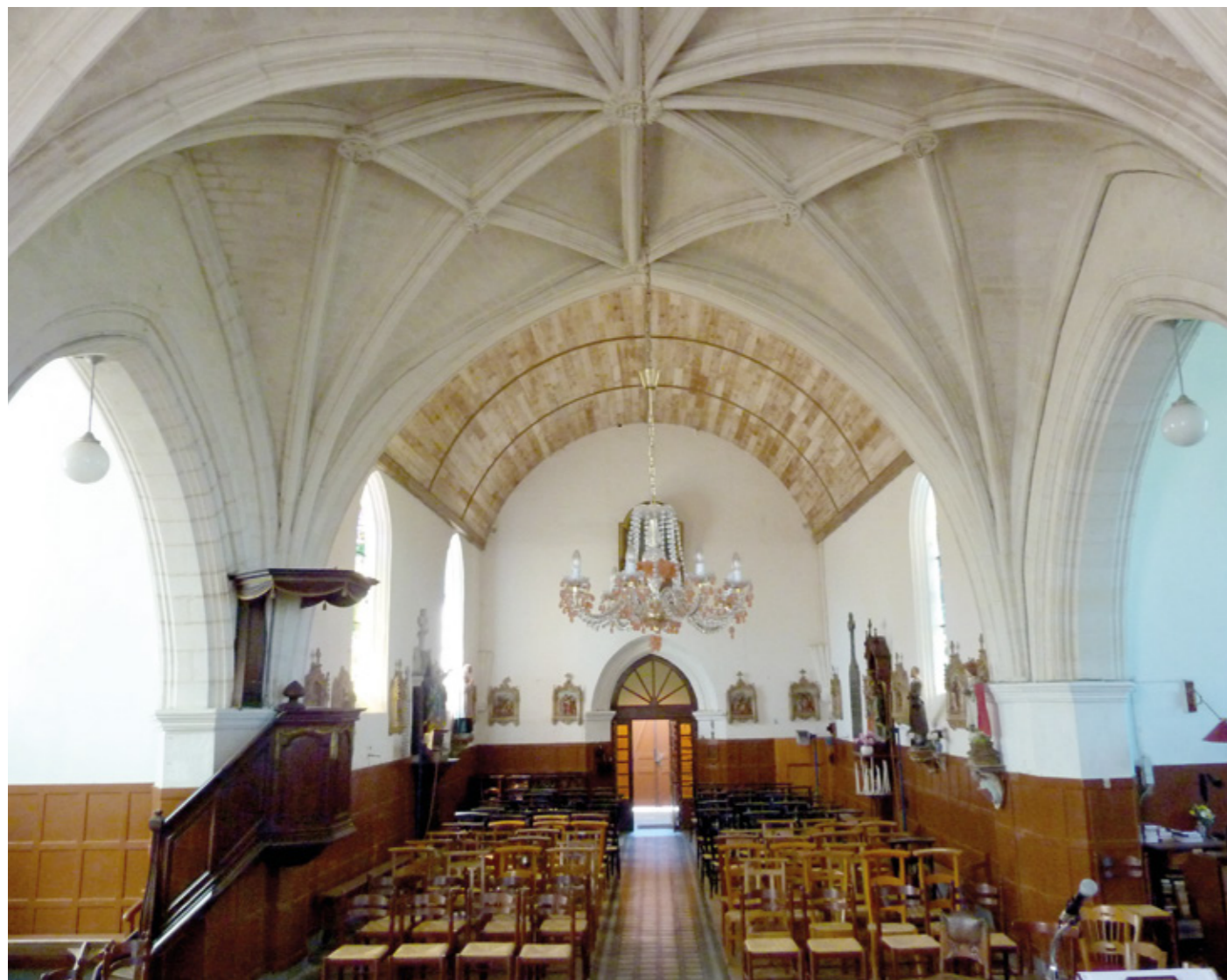
5. Vue de l'intérieur