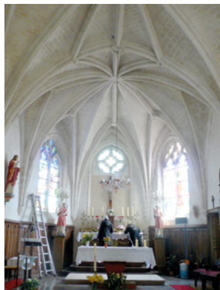
6. Vue du chœur