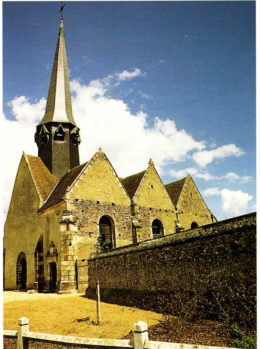
Beauche (Eure-et-Loir) Église Saint-Martin 1. Plan (J.L. Latour et R. Martin, arch.) 2. Façade sud