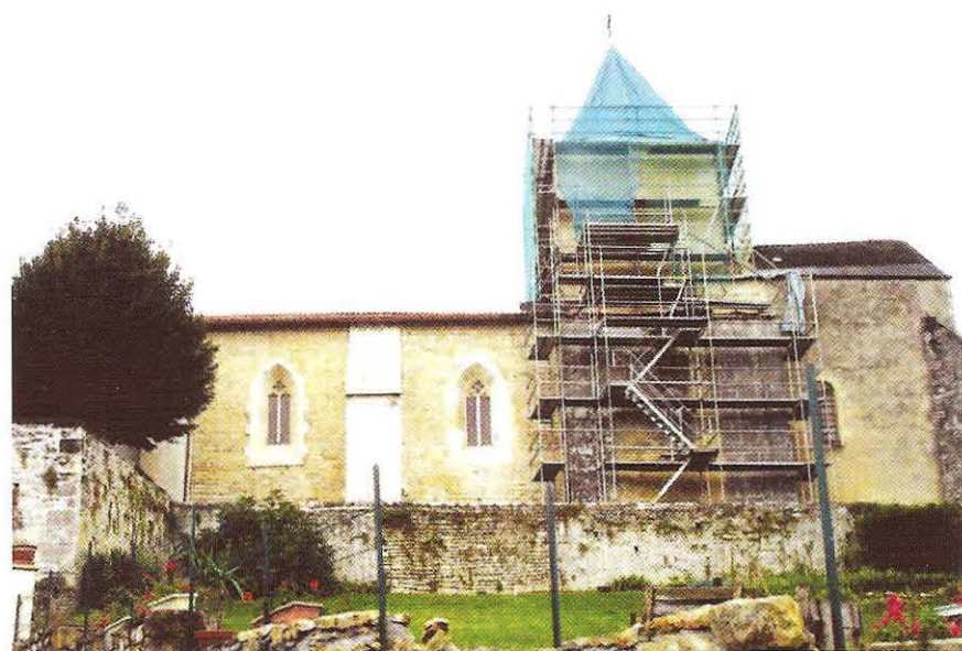
4. Façade sud pendant travaux