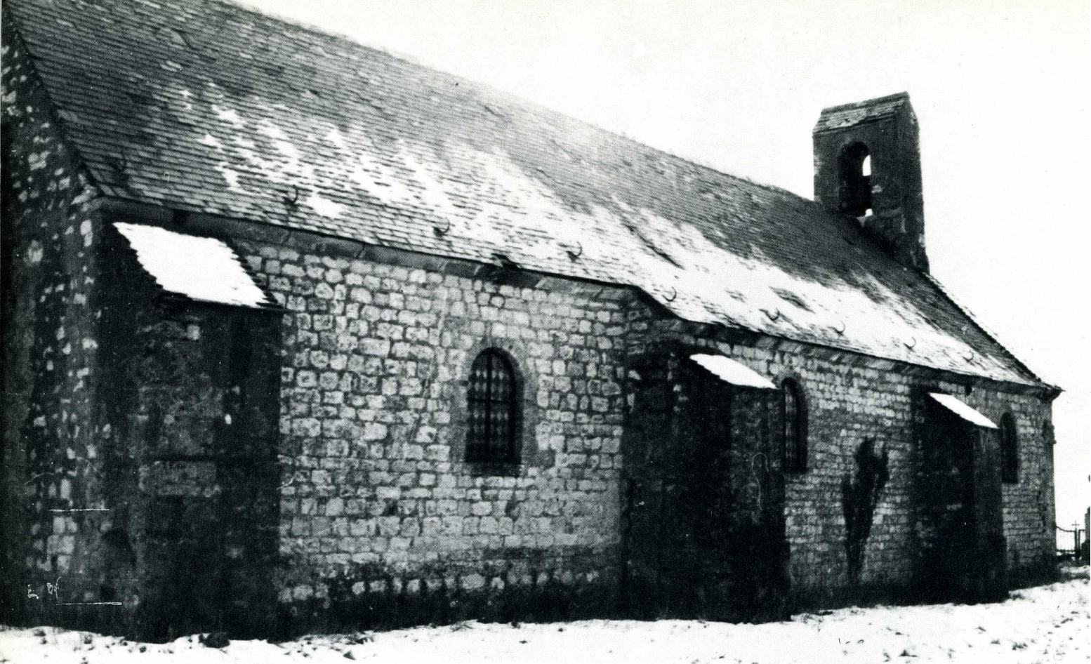
Belle-et-Houllefort (Pas-de-Calais). Église Saint-Michel de Houlle.