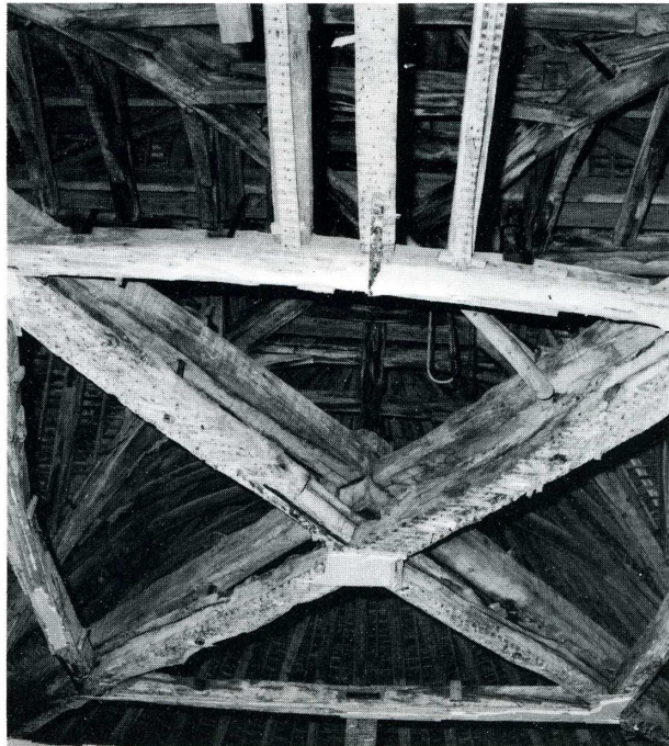
Bernouil (Yonne). Église près de l'ancien château.