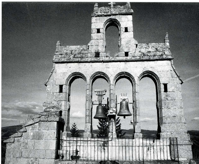
Blavignac (Lozère). Église Saint-Julien, clocher-peigne.

(Lozère, canton de Saint-Chély-d'Apcher, arrond. de Mende, 246 hab.)