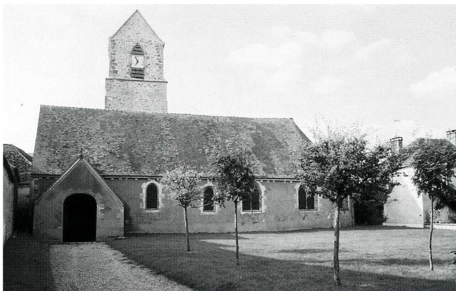
Bleury (Eure-et-Loir), église Saint-Martin, façade sud avec le porche d'entrée.

Eure-et-Loir, canton de Maintenon, arrond. de Chartres, 395 hab.