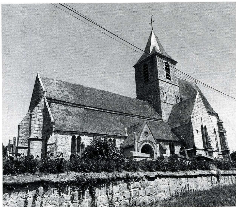
Blosseville-sur-Mer (Seine-Maritime). Église Saint-Martin, vue du sud-ouest.

(Seine-Maritime, canton de Saint-Valéry-en-Caux, arrond. de Dieppe, 251 hab.)