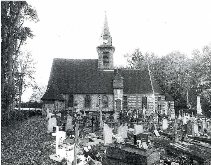
Bois-Héroult (Seine-Maritime). Église Notre-Dame, vue du sud ; ancien porche Renaissance et plan.