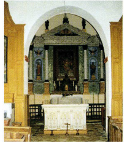
Boisseau (Loir-et-Cher) Église Saint-Pierre Arc triomphal et chœur