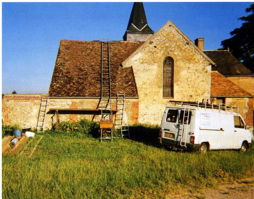
Boissy-le-Bois (Oise) Église Notre-Dame-de-la-Nativité 1. Chevet de l'église et sacristie pendant les travaux 2. Plan