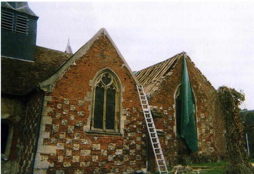
Boissy-le-Bois (Oise) Église Notre-Dame-de-la-Nativité 3. Saint Sébastien et saint Antoine 4. Chapelle sud pendant les travaux