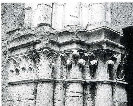
Bouffignereux (Aisne). Église Saint-Rémi, chapiteaux de la porte occidentale.

L' ÉGLISE Saint-Rémi, de la seconde moitié du XII e s. et du début du XIII e s., a conservé une nef non voûtée, éclairée par des fenêtres en plein cintre au-dessus de grands arcs brisés sans décor, aujourd'hui murés, qui ouvraient sur les bas-côtés en partie supprimés au XIX e s. L'arc triomphal à double rouleau précède le chœur à chevet plat et voûté sur une croisée d'ogives à double tore. Les chapiteaux de la porte occidentale et du chœur sont ornés de crochets, de feuillages longs et plats particulièrement soignés.