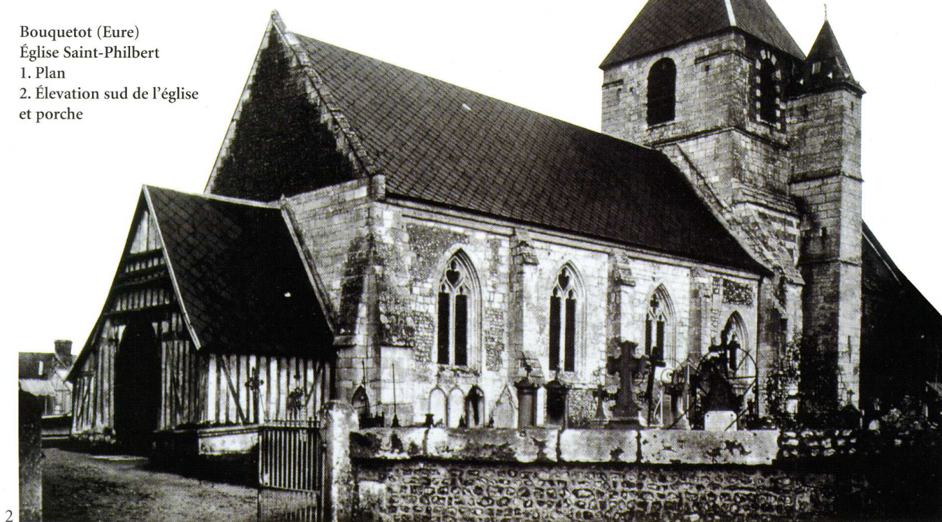
Bouquetot (Eure) Église Saint-Philbert 1. Plan 2. Élévation sud de l'église et porche

L'église de plan allongé se compose de deux rectangles emboîtés, dominés par une tour de plan carré ; elle est précédée d'un porche en pan de bois et possède une sacristie adossée au chœur, installée dans une ancienne chapelle