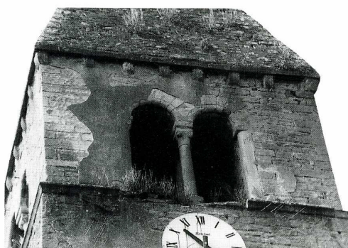
Boyer (Saône-et-Loire). Église Saint-Victor et Saint-Loup, clocher, baies géminées côté nord et plan.

La tradition veut que l'église Saint-Victor et Saint-Loup de Boyer ait été construite sur l'emplacement d'un oratoire où saint Loup, évêque de Chalon, se retirait pour prier. Son existence est attestée par une charte de 923. Elle se trouve à proximité du château et de la fontaine dits de Saint-Loup. L'architecture de l'édifice actuel présente la curieuse juxtaposition des styles roman et néo-classique : d'un édifice remontant aux XI e et XII e s. subsiste en effet une travée surmontée d'un clocher. Celui-ci, de plan carré, est ouvert sur trois de