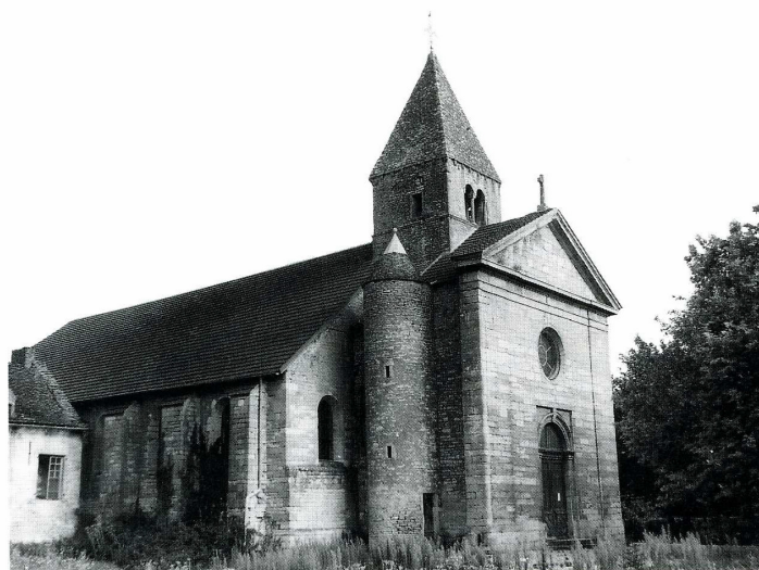
Boyer (Saône-et-Loire). Église Saint-Victor et Saint-Loup.

Saône-et-Loire, canton de Sennecey-le-Grand, arrond. de Chalon-sur-Saône, 655 hab.