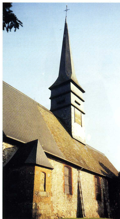
É. G.-C. 1

Pour des travaux d'assainissement, la couverture du clocher et la pose d'un paratonnerre, la Sauvegarde de l'Art français a octroyé une subvention de 11 434 € en 2000.