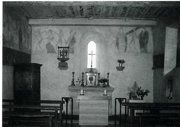
Brianny (Côte-d'Or). Chapelle Sainte-Apolline avant travaux et fresques de danse macabre.

La chapelle Sainte-Apolline de Brianny s'élève dans la campagne un peu en dehors du village. Elle est citée dès 1145 et a dépendu jusqu'en 1789 de Montigny-sur-Armençon. C'est une petite construction orientée, comprenant une nef unique de forme rectangulaire dont les murs ne sont pas tout à fait parallèles, précédée d'un vestibule trapézoïdal à entrée latérale. La nef est couverte d'un plafond lambrissé dissimulant la charpente et éclairée par trois baies étroites ébrasées, en plein cintre. Deux sont percées dans le mur gouttereau sud et la troisième au centre du chevet plat. Le vestibule est surmonté d'un clocheton carré couvert de tavaillons se terminant en flèche. La toiture de l'église est faite de tuiles plates et surmontée au pignon est d'une croix en pierre récemment restaurée. Les murs intérieurs du chœur de la chapelle sont décorés de peintures du XVI e s. représentant une danse macabre, classées par les Monuments historiques. L'humidité ayant fait de lourds ravages dans les murs de la chapelle, la Sauvegarde de l'Art Français a versé en 1990 une subvention de 15 000 F afin de pouvoir procéder à un assainissement général de l'édifice.