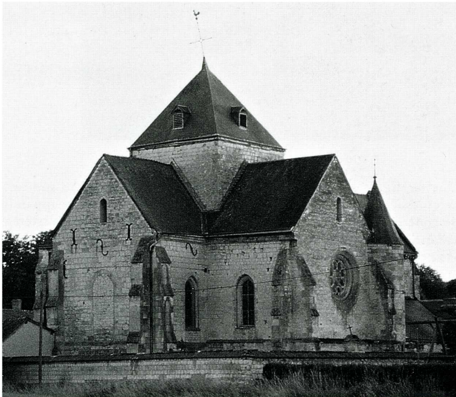
Brienne-sur-Aisne (Ardennes). Église Saint-Jean-Baptiste. 1- Plan, éch. 0,005 (Th. Legendre arch.). 2- Vue du nord-est.