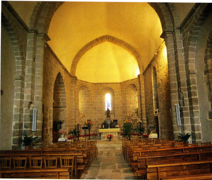
Brillac (Charente) Église Saint-Pierre 3. Vue intérieure vers l'abside 4. Plan (P. Lepkowski, arch., 2002)