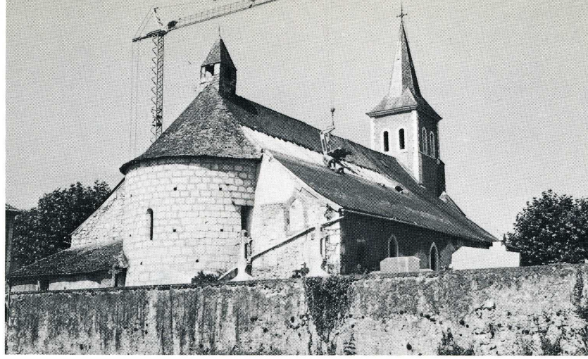
Bruges-Capbis-Mifaget (Pyrénées Atlantiques). Église Saint-Michel de Mifaget.