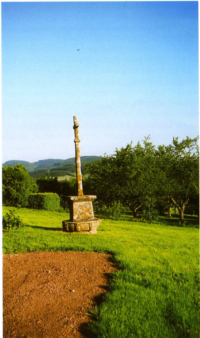
Buffières (Saône-et-Loire) Église Saint-Denis 3. Le calvaire situé au sud de l'église