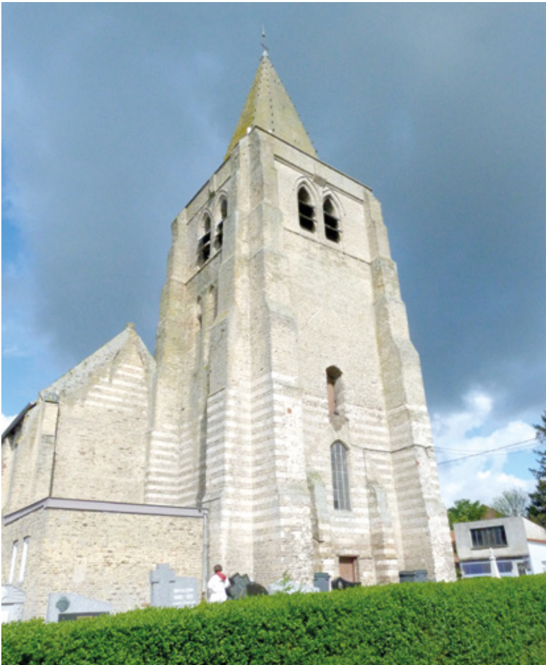
2. Façade occidentale