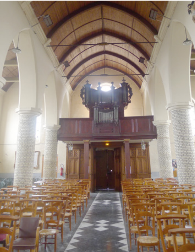
5. Vue vers l’entrée