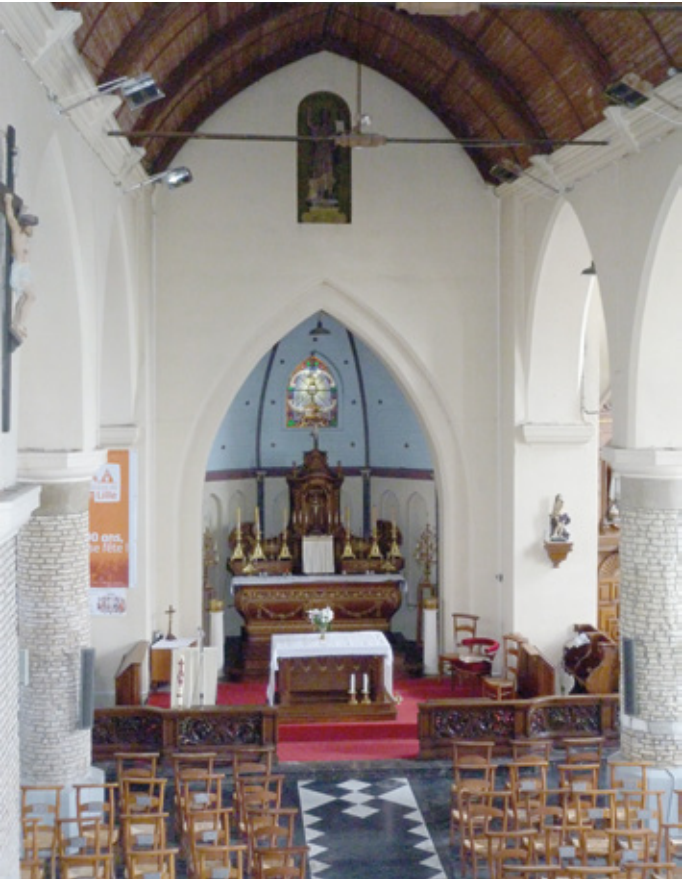
4. Vue intérieure vers le chœur