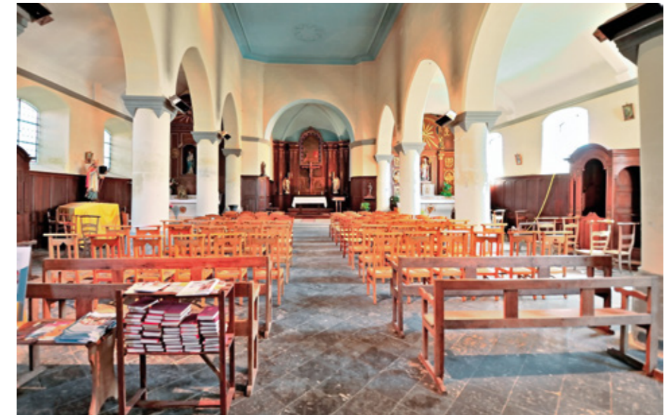
5. Vue intérieure vers le chœur

plus importante fut menée en 1858 sous la direction d'André de Baralle, architecte à Cambrai.