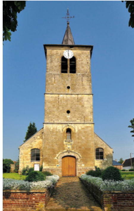
1. Clocher-porche en façade occidentale

Canton Caudry, arrondissement Cambrai, 596 habitants