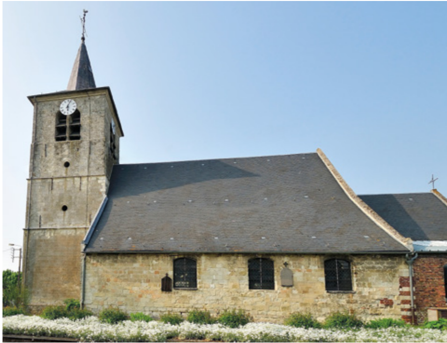
3. Façade sud

É GLISE SAINT-GÉRY. Comme celle de la paroisse voisine de Naves, l'église de Cagnoncles était rattachée au chapitre de la collégiale Saint-Géry de Cambrai.