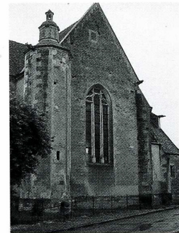
Carisey (Yonne), église Notre-Dame et Saint-Vincent, bras sud du transept et tourelle d'escalier.

L'église Notre-Dame et Saint-Vincent de Carisey est un petit édifice Renaissance très homogène. Elle se compose d'une nef de deux travées précédée par un clocher-porche et d'un large transept sur lequel est greffée à l'est, sur chaque bras, une chapelle communiquant avec le chœur. Le sanctuaire se termine par un chevet à cinq pans. L'ensemble de l'édifice est voûté sur croisées d'ogives dont les nervures pénètrent dans des colonnes engagées dépourvues de chapiteau. L'absence de vitraux et le badigeon blanc qui recouvre les murs donnent à l'édifice une grande luminosité. L'abside est percée de cinq baies à remplages, dont l'une a été obstruée lors de la construction de la sacristie au sud. Dans le transept sont conservées des fresques du XVI e s. représentant divers saints et une Vierge en majesté. La nef ne compte que deux fenêtres, ménagées dans les murs gouttereaux de la première travée. Des portes à linteau droit s'ouvriraient autrefois sous ces ouvertures. L'extérieur présente la même homogénéité stylistique que l'intérieur. L'ensemble est construit en moellon de silex ; seuls les chaînages d'angle, les contreforts, les rampants, le soubassement et le contour des ouver-