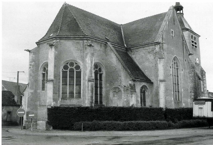
Carisey (Yonne), église Notre-Dame et Saint-Vincent. 1. Vue d'ensemble du chevet, angle nord-est. 2. Chapelle sud (cl. A. Leriche, arch., juin 1991). 3. Plan d'Antoine Leriche, arch., éch. 0.005 (juillet 1992).