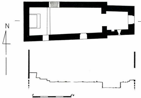
Ceyras (Hérault). Église Saint-Pierre de Leneyrac, arc triomphal du chœur et plan.

se termine à l'est par un chœur quadrangulaire à chevet plat. La nef est formée par des murs goutterots qui étaient destinés à supporter une charpente, écroulée au début du siècle. Le chœur, dont les murs ont été renforcés, est voûté en berceau plein cintre. La naissance de la voûte repose sur une corniche dont la section dessine un biseau sous listel. A l'entrée du chœur, des piliers supportent des impostes massives à mouluration complexe. L'arc triomphal légèrement outrepassé repose en retrait sur ses supports. Sur le mur sud de la nef s'ouvrent deux portes. Celle située plus à l'ouest est surmontée d'un arc en gouttière, bâti de dix claveaux dont les premiers retombent en retrait sur les pieds-droits. Un petit clocher-mur percé d'une large baie en plein cintre couronne l'édifice. La forme des fenêtres du chœur, que l'on retrouve sur une fenêtre de la crypte de la cathédrale Saint-Fulcran à Lodève, antérieure à 975, permet d'envisager une datation préromane pour cette chapelle. Au XVII e s. un nouveau chœur fut aménagé à l'ouest de la nef et l'ancien chœur transformé en porche d'entrée à l'est. Un ermitage était adossé contre le mur sud de la nef et aurait été reconstruit au XVIII e s. Une somme de 40 000 F a été versée en 1989 par la Sauvegarde de l'Art Français pour permettre la consolidation de l'édifice et sa mise hors d'eau.