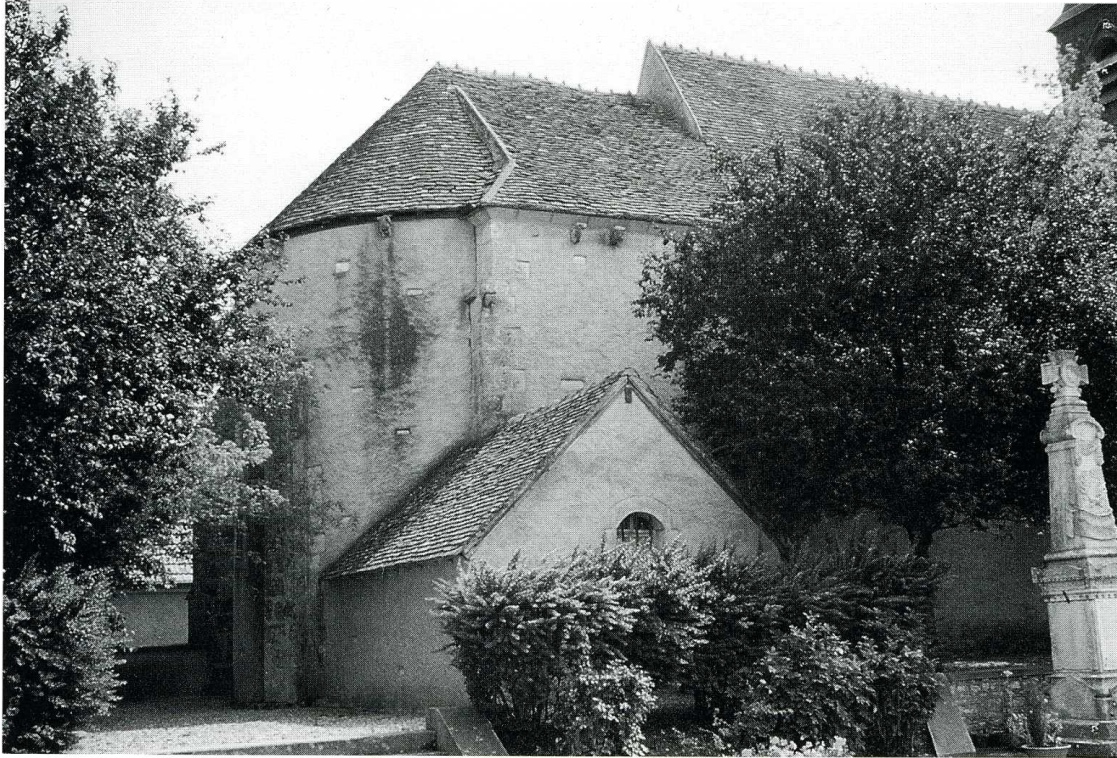
Chambon (Cher), église Saint-Pierre. Chevet.

L' église Saint-Pierre, citée dès 1123 dans une bulle du pape Calixte II parmi les possessions de l'abbaye Saint-Sulpice de Bourges, est, malgré sa modestie, un édifice remarquable par sa date de construction (premier quart du XII e s.), son homogénéité et l'intérêt de son décor.