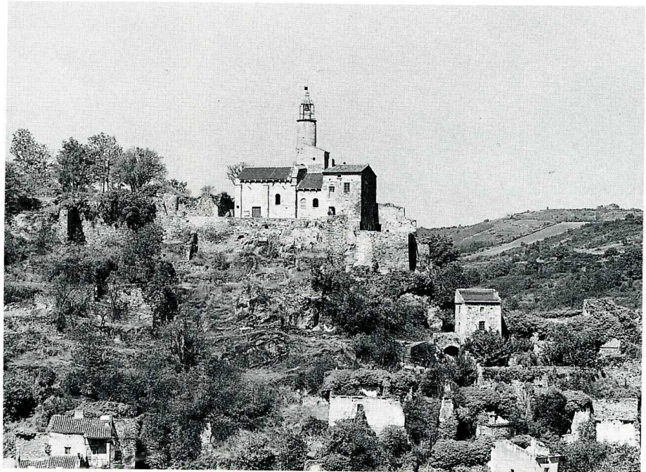
Champeix (Puy-de-Dôme). Chapelle Saint-Jean.

Puy-de-Dôme, chef-lieu de canton, arrond. d'Issoire, 1 087 hab.