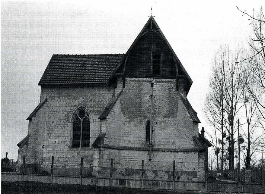
Champigny-sur-Aube (Aube). Église de l'Assomption.

des croisées d'ogives par l'intermédiaire de très beaux chapiteaux ornés de feuillages, d'animaux fantastiques ou de têtes humaines, décor que l'on retrouve sur les chapiteaux des colonnes engagées qui subsistent le long des murs.