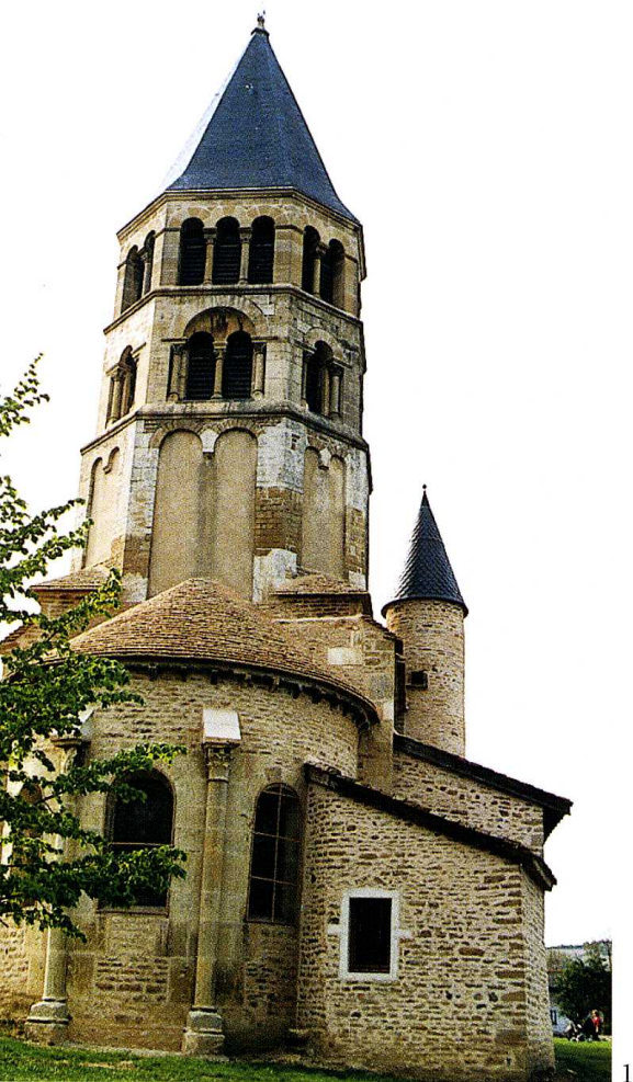
Chânes (Saône-et-Loire) Église Saint-Pierre-Saint-Paul 1. Chevet de l'église 2. Plan (H. Gignoux, arch.) 1996

Saône-et-Loire, canton La Chapelle-de-Guinchay, arrondissement Mâcon, 530 habitants