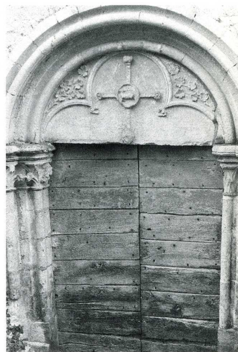
La Chapelle-Vaupelteigne (Yonne).