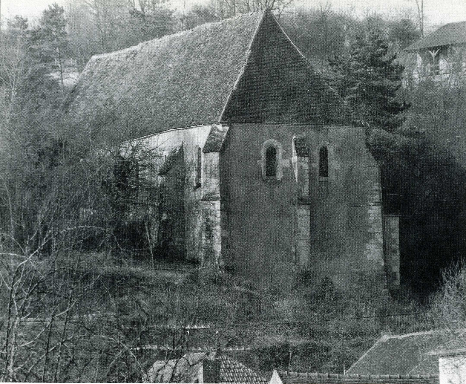
La Chapelle-Vaupelteigne (Yonne).