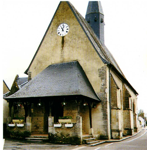
Charentilly (Indre-et-Loire) Église Saint-Laurent 1. L'église vue de l'ouest 2. Coupe longitudinale (Atelier d'arch. B. Penneron) 3. Plan (Atelier d'arch. B. Penneron)

L'ÉGLISE PAROISSIALE dédiée à saint Laurent appartenait aux chanoines de Saint-Martin de Tours. Son plan est très simple : une nef unique en grande partie du XII e s., reprise au XVI e (ouverture et contreforts), prolongée par un chœur du XIII e à chevet plat et fenêtre d'axe. Le XIX e siècle (1844-1845) a ajouté un bas-côté vers le nord ouvert par quatre grandes baies sur l'édifice primitif ; ce bas-côté est couvert d'une fausse voûte en brique, alors que la nef et le chœur sont couverts d'une charpente lambrissée à poinçons et entrails contemporains des reprises du XVI e siècle. Un porche de charpente a été bâti à cette époque en avant de la porte romane occidentale ; cette dernière, dont les piédroits ont été modifiés, a gardé ses voussures comportant en alternance deux tores cylindriques et deux rangs d'étoiles. On a regroupé dans les fenêtres du chevet des médaillons et fragments de vitraux du XIII e siècle. Un autre vitrail des XV-XVI e s. est conservé dans une fenêtre de la nef.