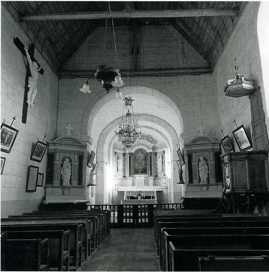
Chartrené (Maine-et-Loire), église Saint-Maurice. Vue intérieure vers l'abside.

paire de colonnettes est surmontée de petits chapiteaux ornés de feuilles d'acanthé extrêmement rustiques. Un décor de chevrons anime l'archivolte. La nef reçoit également de la lumière par l'oculus ouvert dans le mur pignon et dont un claveau porte la date 1734. Ce percement se superpose à une baie romane attestée par la modénature à motifs de chevrons de l'archivolte. L'étage du clocher date du XVIII e s. et le clocher s'achève par une flèche octogonale à égout retroussé de plan carré. L'abside semi-circulaire conserve apparentes deux baies romanes et possède à son niveau supérieur des corbeaux cubiques soutenant une corniche à motif de cannage. A l'intérieur, en fond d'abside, se dresse un intéressant retable du XVII e s. en pierre tandis que la nef accueille deux autels latéraux du XVIII e s. dotés de tombeaux fortement galbés. La petite église de Chartrené construite au XII e s. se signale par la qualité de ses proportions, la simplicité dans l'agencement des masses architecturales. Les remaniements apportés au XVIII e s. n'ont pas altéré les volumes et couvrements romans. Des travaux de drainage et de consolidation du mur goutterot sud de la nef ont été effectués. La Sauvegarde de l'Art Français a octroyé une subvention de 15 000 F en 1995.