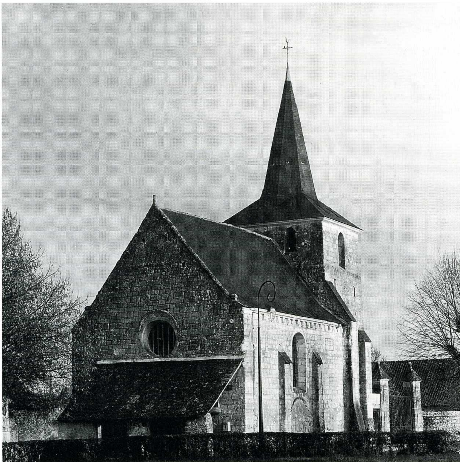
Chartrené (Maine-et-Loire), église Saint-Maurice. Vue du sud-ouest.

Il existait déjà une église à Chartrené au milieu du VII e s. fondée selon la tradition par saint Mainbœuf, évêque d'Angers. La terre de Chartrené comptait parmi les possessions des comtes d'Anjou et l'on sait qu'à la fin du X e s., Foulque Nerra céda la terre de Chartrené au seigneur de Beaupréau. Le fils de ce dernier, seigneur de Vieil-Baugé, la donna à son tour vers 1016-1027 à l'abbaye Saint-Aubin d'Angers, laquelle y installa un prieuré. L'église de Chartrené édifiée au XII e s. et placée sous le vocable de saint Maurice succède ainsi à un édifice plus ancien. De dimensions modestes, elle a conservé sa configuration architecturale romane. Les travaux de la première moitié du XVIII e s. ont porté sur la création de nouvelles baies, sur des réaménagements intérieurs et sur la reconstruction de l'étage du clocher et de la flèche. L'édifice construit en pierre