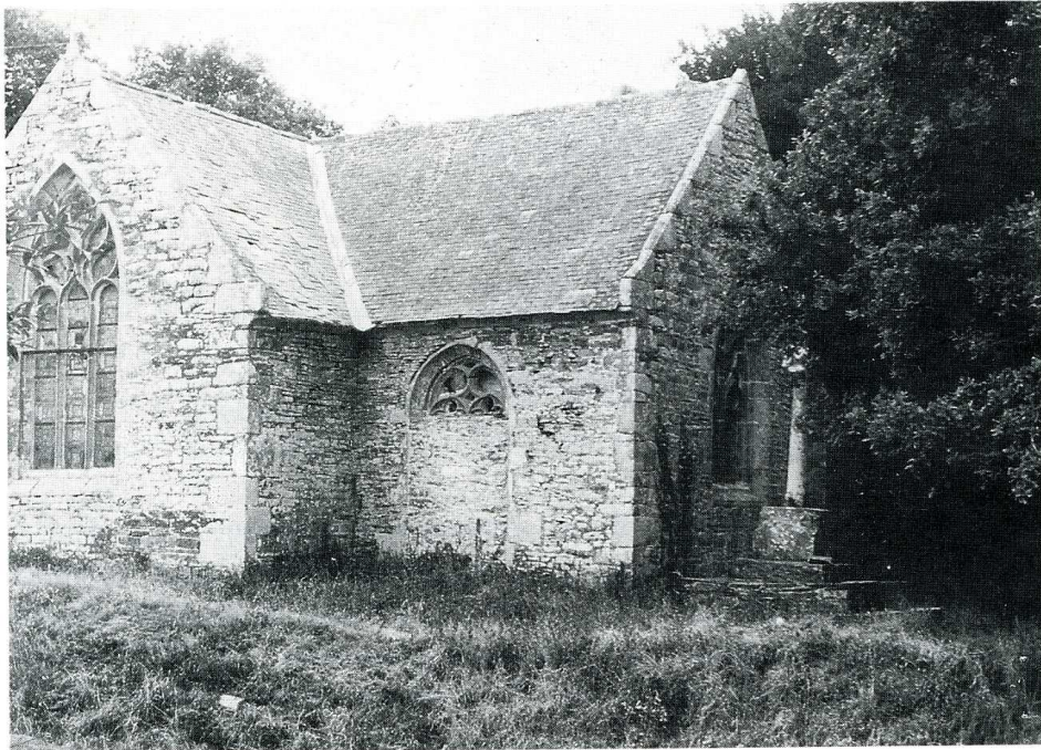
Châteauneuf-du-Faou (Finistère). Chapelle Saint-Ruellin.

entretenir et protéger ce sanctuaire. Ces travaux, très importants, ont été répartis sur plusieurs campagnes : en 1985, dégagement d'un pilier de granit inclus dans du béton, et réfection totale de la façade ouest. La Sauvegarde a alors versé une subvention de 15 000 F. Cette aide a été portée à 30 000 F en 1986 pour la deuxième campagne, concernant la reprise de la charpente et de la couverture.