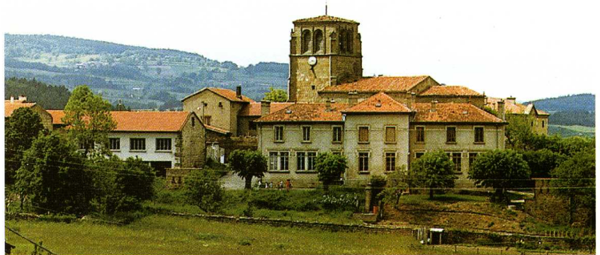
Chazelles-sur-Lavieu (Loire) Église Saint-Michel 1. Vue d'ensemble 2. Tour occidentale

CETTE église d'altitude (911 m) est sous le vocable attendu de saint Michel. En tant qu'église paroissiale, elle tire sans doute son origine d'une chapelle castrale, et il n'est pas certain qu'une véritable église ait précédé l'édifice actuel du XV e siècle.