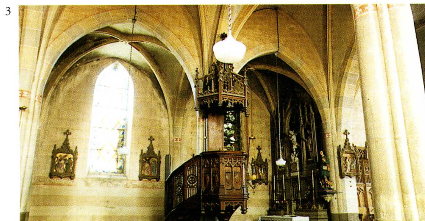
Chazelles-sur-Lavieu (Loire) Église Saint-Michel 1. Plan (H. Lazar, ABF) 1997 2. Porche occidental 3. Nef et bas-côté nord