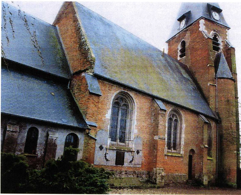
Chépy (Somme) Église Saint-Pierre-et-Saint-Paul (cl. et plan Ag. Roux-Tognella) 1. Façade nord 2. Plan