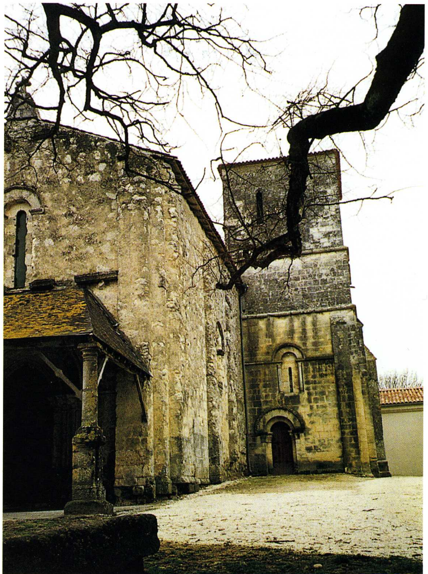
Chérac (Charente-Maritime) Église Saint-Gervais-et-Saint-Protais 1. Chevet 2. Vue sud-ouest