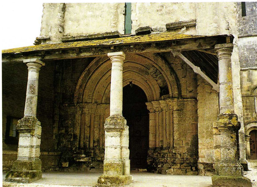
Chérac (Charente-Maritime) Église Saint-Gervais-et-Saint-Protais 1. Porche occidental 2. Plan (SDAP)

Un auvent du XVIII e s., appuyé sur la façade occidentale, repose sur trois élégantes colonnes doriques. L'ample portail du XIII e s. comporte quatre voussures soulignées de tores retombant sur des chapiteaux ornés de feuillages. Les travées sont séparées par des colonnes adossées à des pilastres terminés par des chapiteaux sans décor. L'ancien voûtement n'existe plus. Seul le croisillon sud a conservé sa coupole sur pendentifs, surmontée du clocher carré. Les arcs des trois baies du chevet semi-circulaire sont ornés de pointes de diamant.