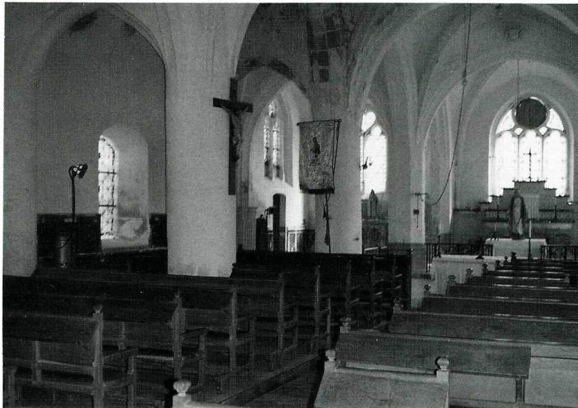
Chéry-Chartreuve (Aisne). Église Saint-Macre, chœur côté nord, nef bas-côté nord et plan.